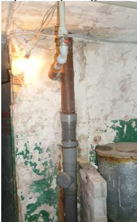
17 pav. Nuotėkų stovas