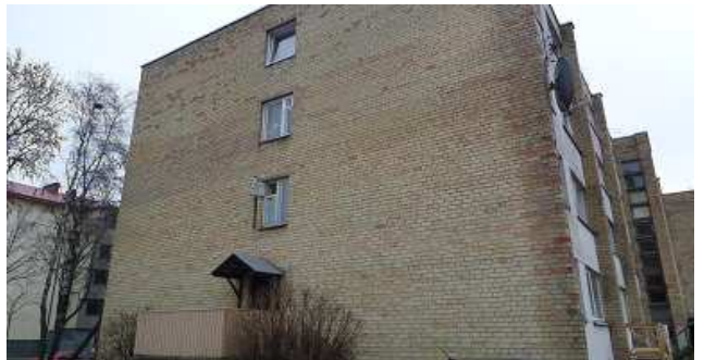
4 pav. Vakarinis fasadas