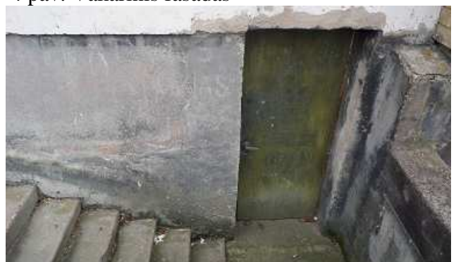
6 pav. Rūsio lauko durys