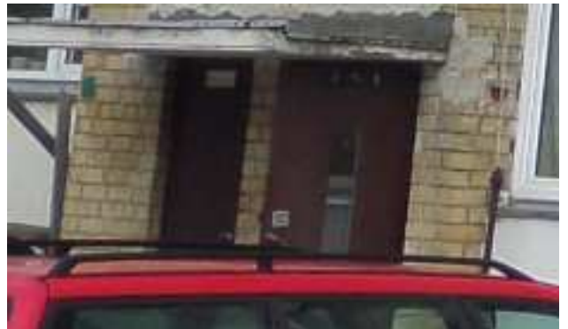
8 pav. Laiptinės ir rūšio lauko durys