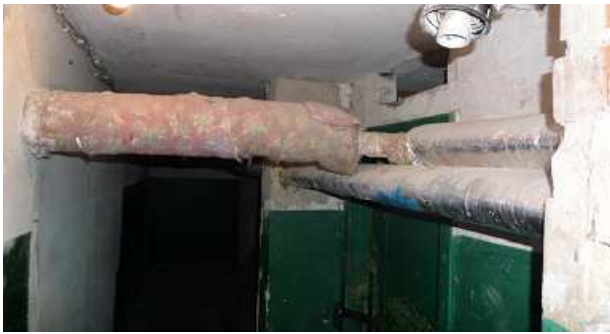
15 pav. Vamzdynai rūsyje