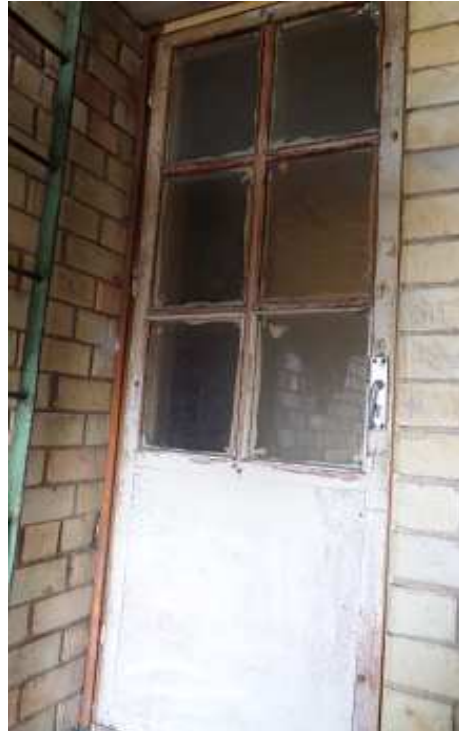
10 pav. Išėjimo į atvirą laiptinę durys