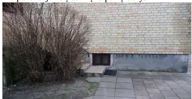
12 pav. Cokolis, rūšio langas