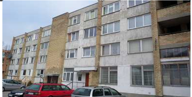
2 pav. Pietinis fasadas