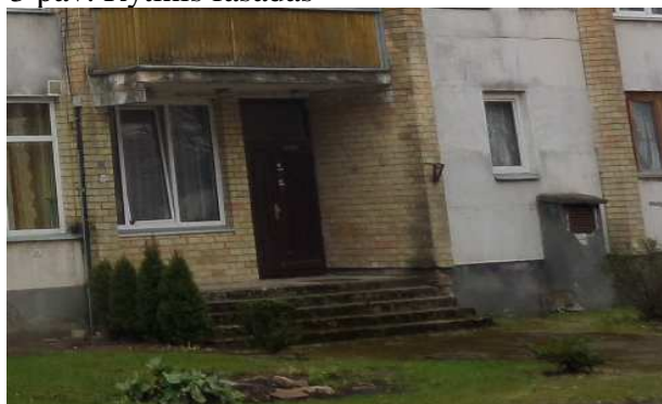
5 pav. Laiptinės lauko durys