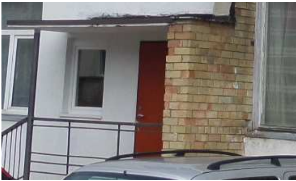
7 pav. Buto lauko durys