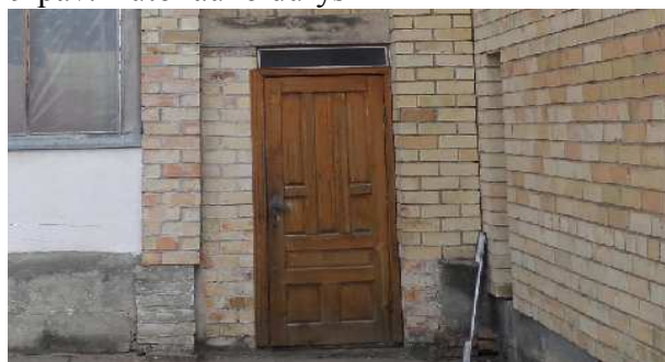
11 pav. Laiptinės laiko durys