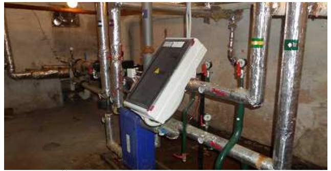
16 pav. Šilumos punktas