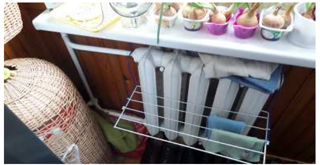
18 pav. Radiatorius bute