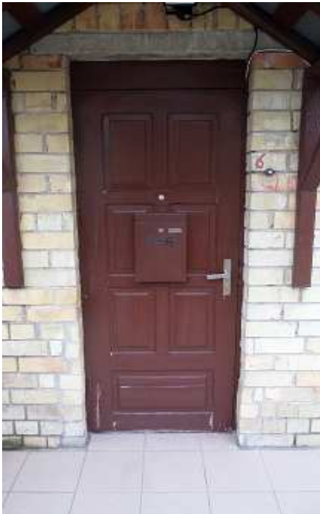
9 pav. Buto lauko durys