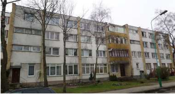
1 pav. Šiaurinis fasadas