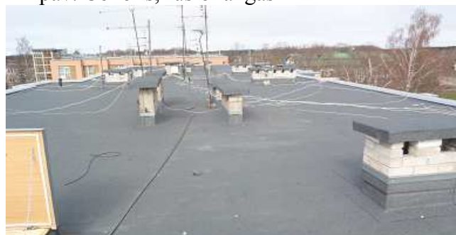
14 pav. Sutapdintas stogas