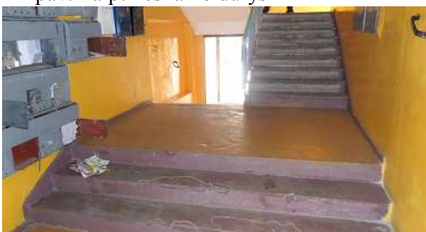
13 pav. Laiptinė