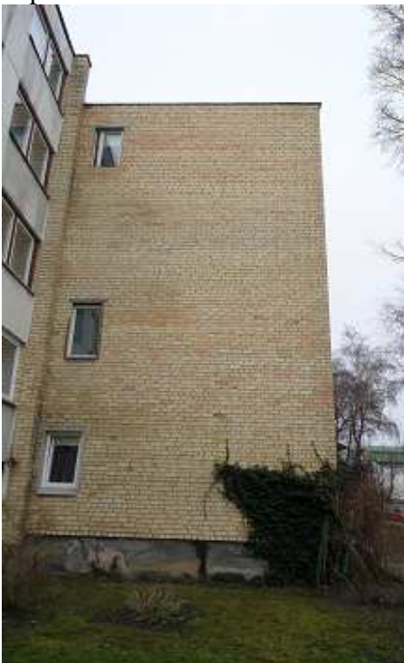
3 pav. Rytinis fasadas