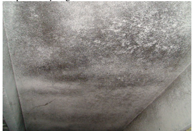
12 pav. Rūšio lubos