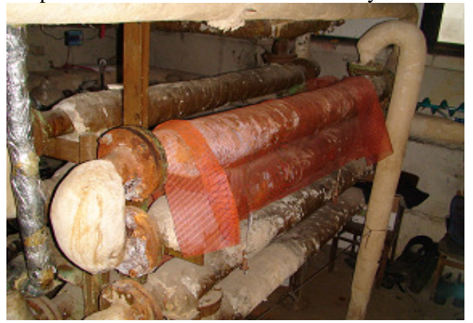
18 pav. KV ruošimo modulis