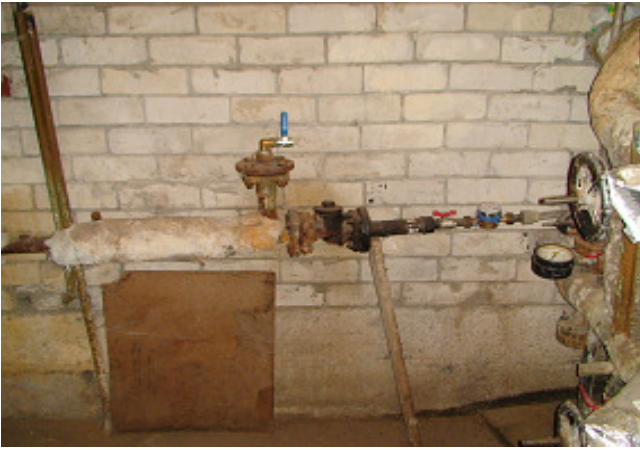
15 pav. Šalto vandens vamzdis