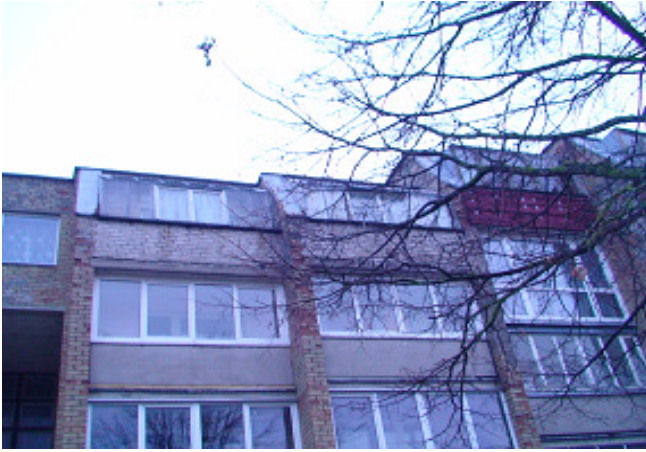
9 pav. Balkonai