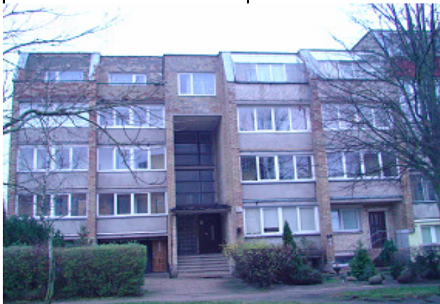
1 pav. Pietvakarų fasadas