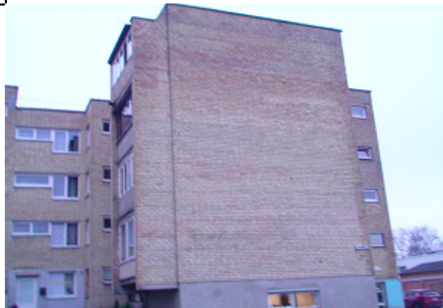
2 pav. Šiaurės rytų fasadas