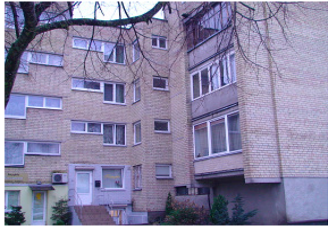
10 pav. Butų langai