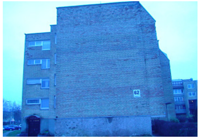
4 pav. Šiaurės vakarų fasadas