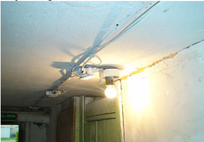
13 pav. El. instaliacija rūsyje