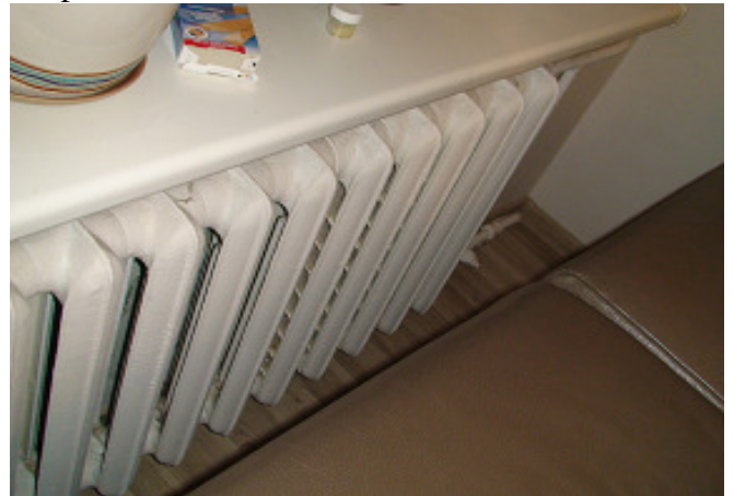
14 pav. Radiatorius bute