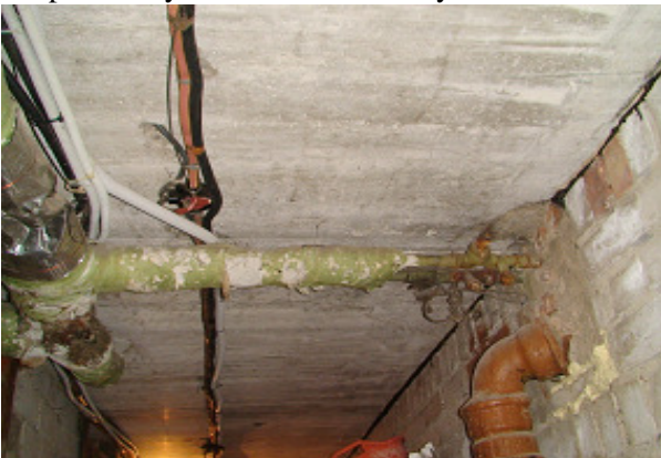
21 pav. Buitinių nuotėkų stovas