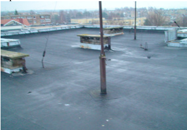
11 pav. Stogas