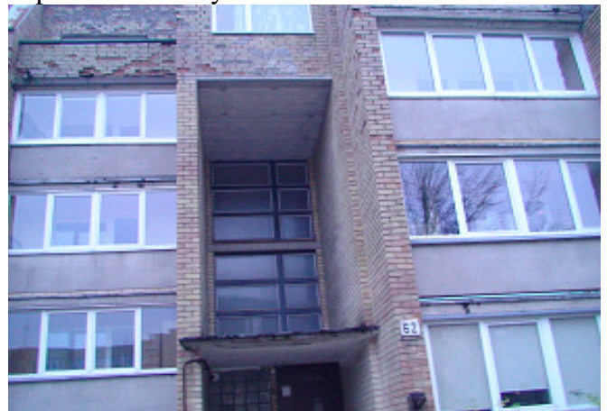
8 pav. Laiptinės langai