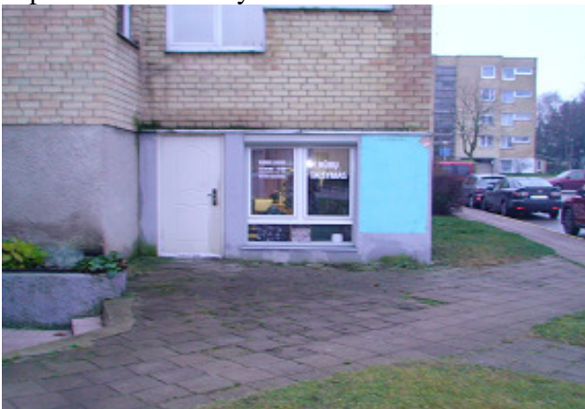
7 pav. Lauko durys