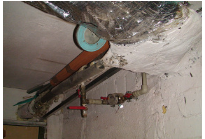
16 pav. Karšto vandens tiekimo vamzdynai