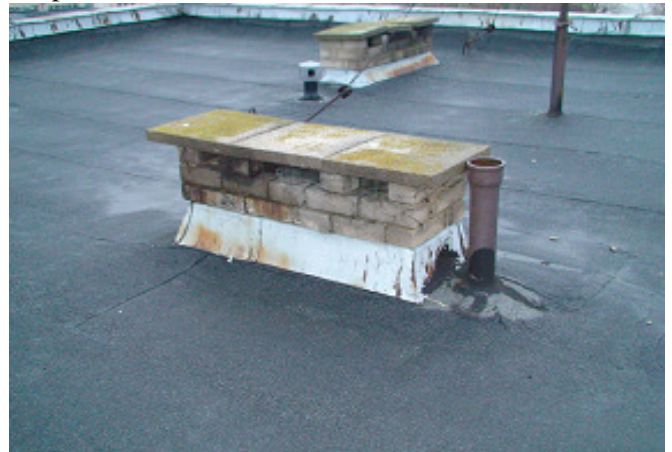
20 pav. Ventiliacijos kanalai