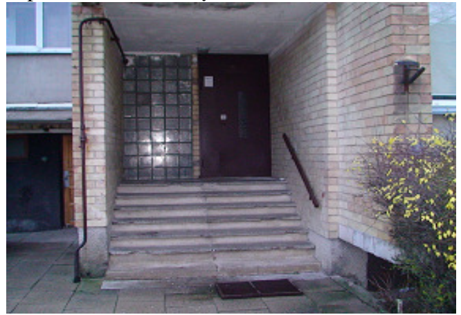
6 pav. Lauko durys