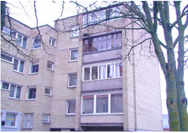
3 pav. Petryčių fasadas