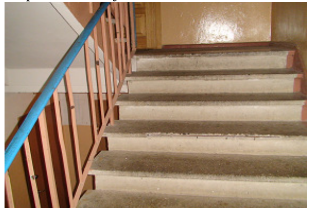
22 pav. Laidinė