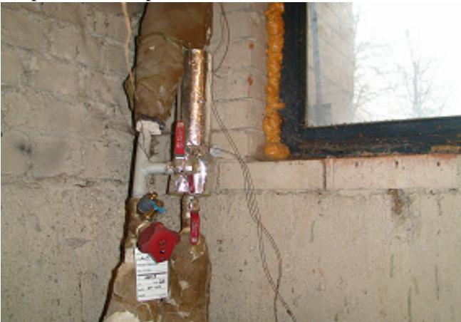
19 pav. Šildymo sistemos vamzdynai