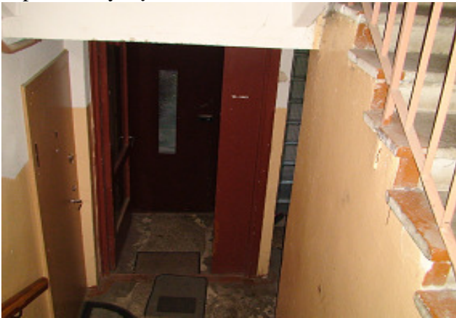
5 pav. Tamburo durys