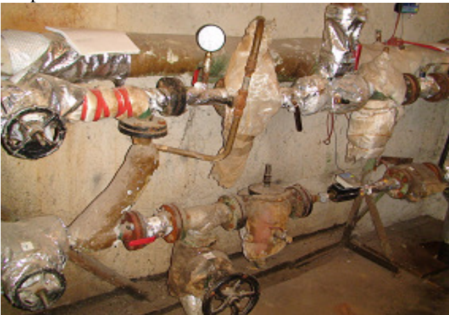
17 pav. Šilumos punktas