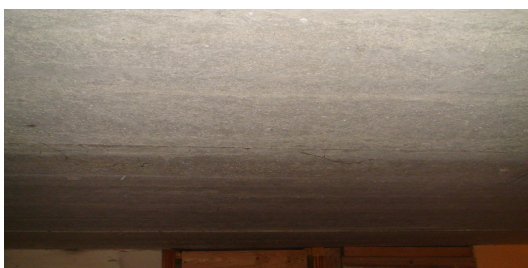
11 pav. Rūšio lubos