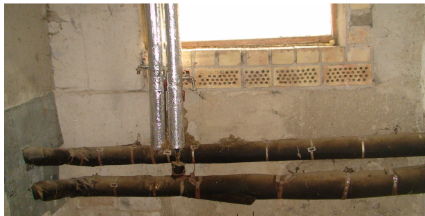
16 pav. Šildymo sistemos vamzdžiai