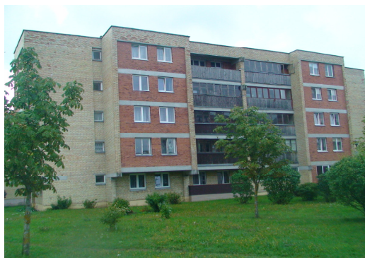
2 pav. Šiaurės vakarų fasadas