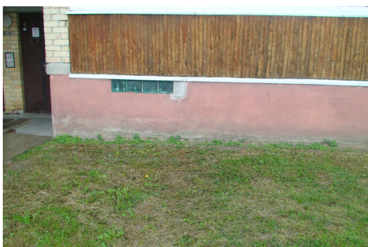
9 pav. Cokolis ir rūšio langas