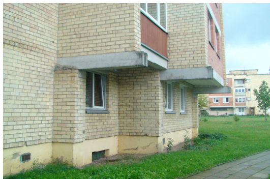
7 pav. Butų langai