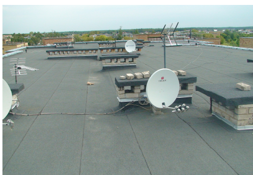
12 pav. Stogas