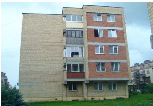
1 pav. Šiaurės rytų fasadas