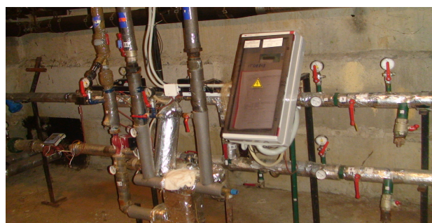
14 pav. Šilumos punktas