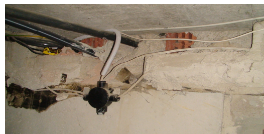
18 pav. El. instaliacija rūsyje