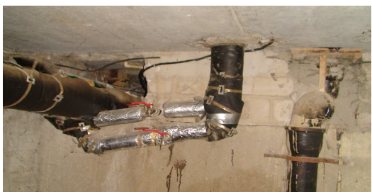
17 pav. KV vamzdynai rūsyje