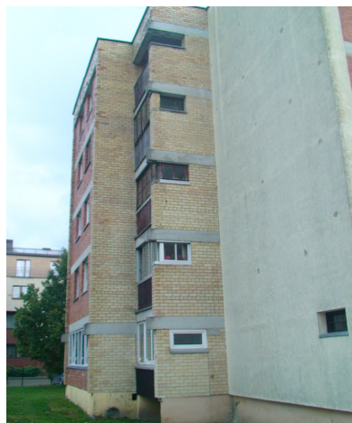
8 pav. Butų balkonai