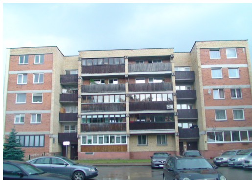
4 pav. Pietryčių fasadas