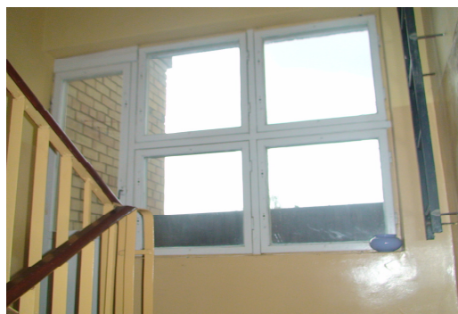
6 pav. Laiptinės langai