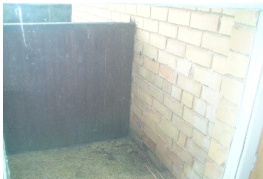
15 pav. Laidinės balkonas