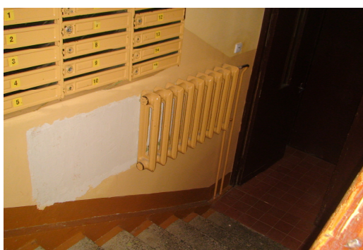
10 pav. Tamburo durys, laiptinės radiatoriai