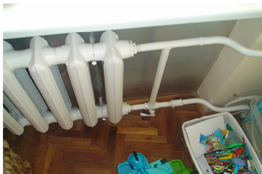
13 pav. Radiatorius bute