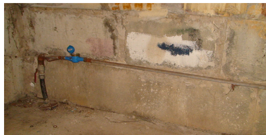
20 pav. Šalto vandens vamzdynai