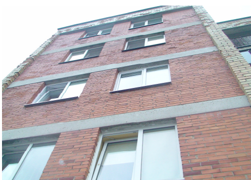
3 pav. Pietvakarių fasadas