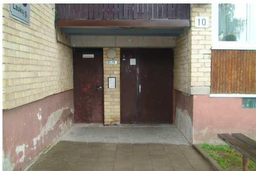
5 pav. Laiptinės ir įėjimo į rūšį lauko durys