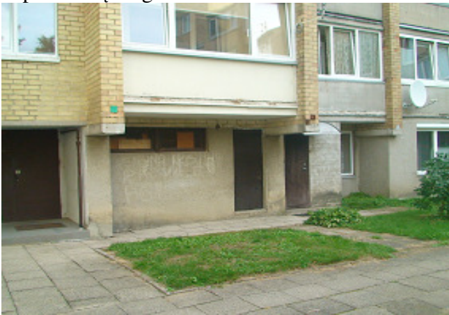
9 pav. Cokolis ir rūšio langas