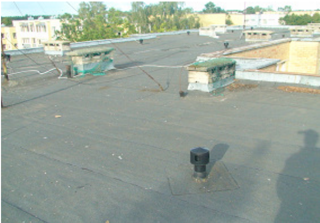
11 pav. Ventiliacijos kaminėlis