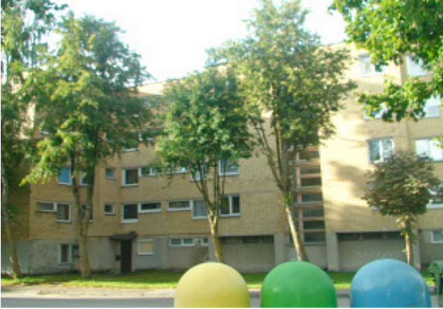
1 pav. Šiaurės rytų fasadas