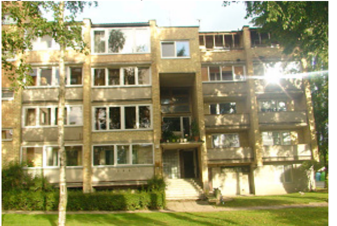
4 pav. Pietryčių fasadas