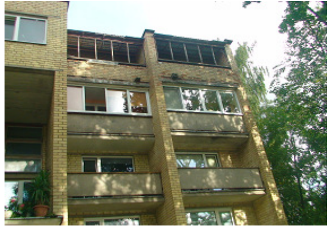
8 pav. Butų balkonai