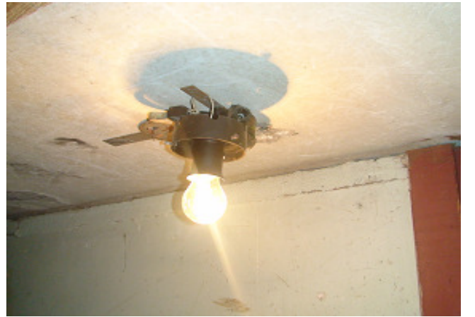
18 pav. El. instaliacija rūsyje