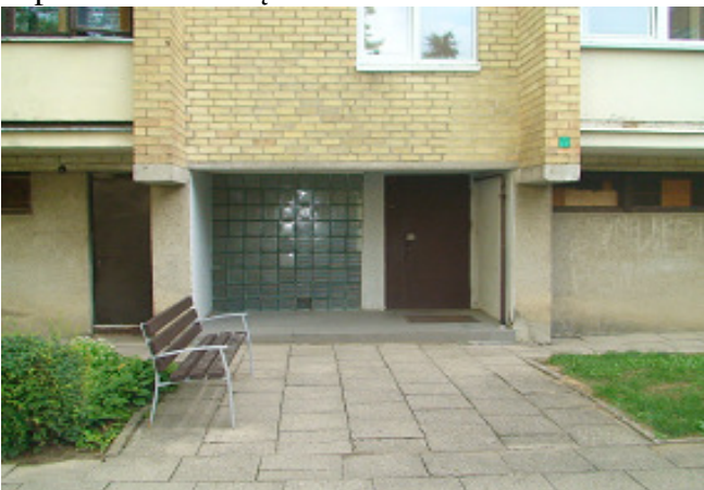
5 pav. Laiptinės ir įėjimo į rūšį lauko durys