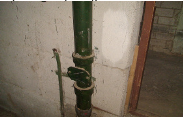
19 pav. Nuotėkų stovas