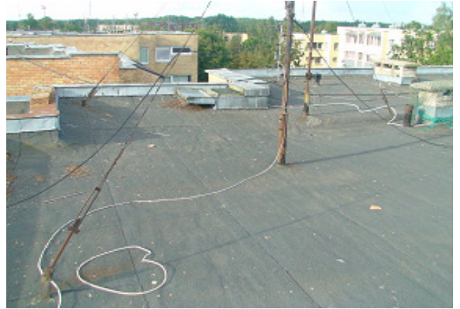
12 pav. Stogas