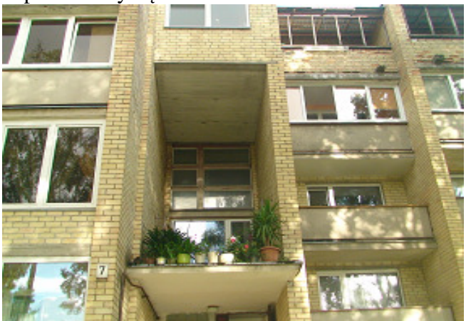
6 pav. Laiptinės langai