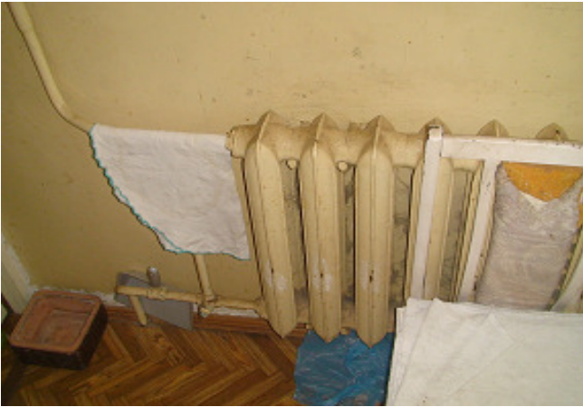
13 pav. Radiatorius bute