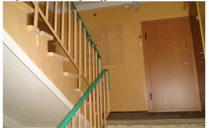
20 pav. Laiptinė