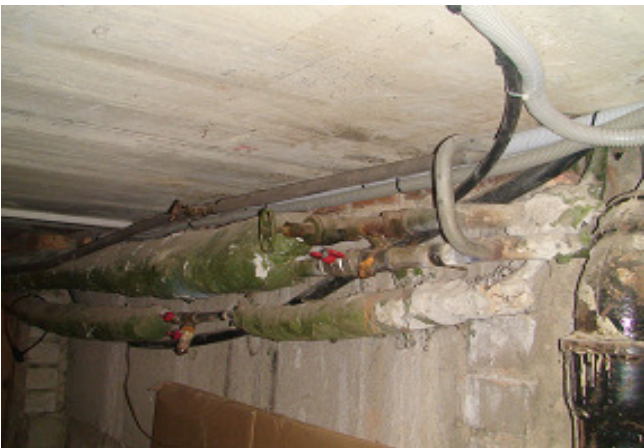
17 pav. KV vamzdynai rūsyje