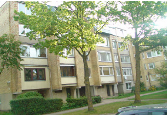
3 pav. Pietvakarių fasadas