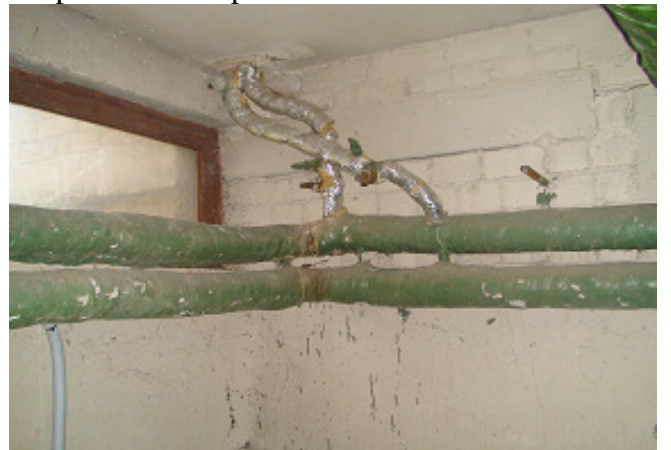
16 pav. Šildymo sistemos vamzdžiai