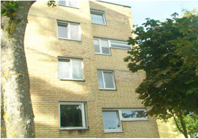
7 pav. Butų langai