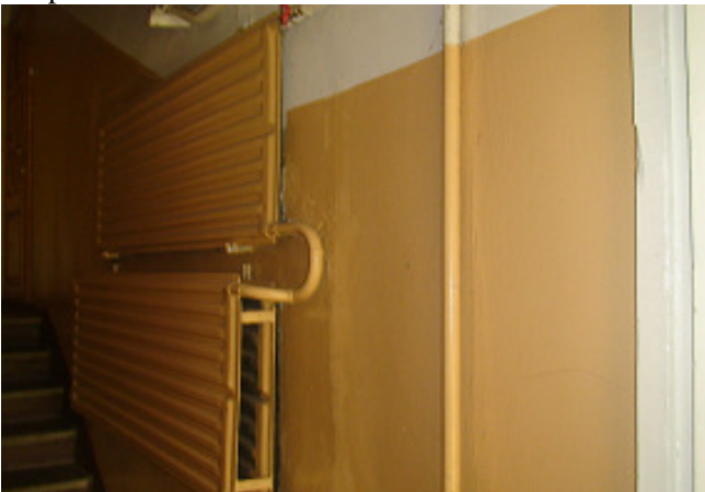
15 pav. Radiatoriai laiptinėje