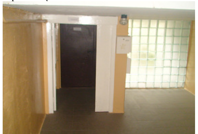
10 pav. Tamburo durys