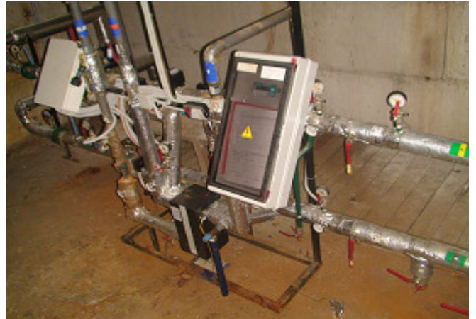
14 pav. Šilumos punktas