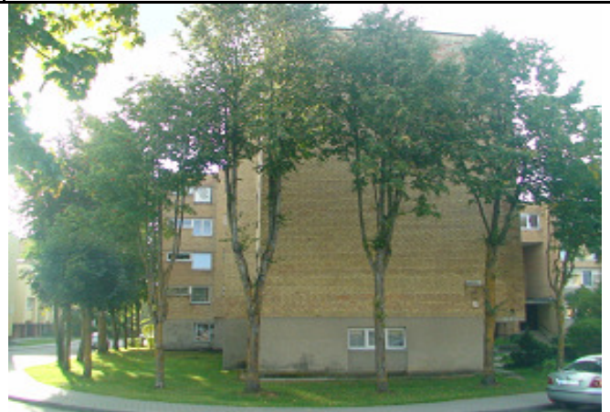
2 pav. Šiaurės vakarų fasadas