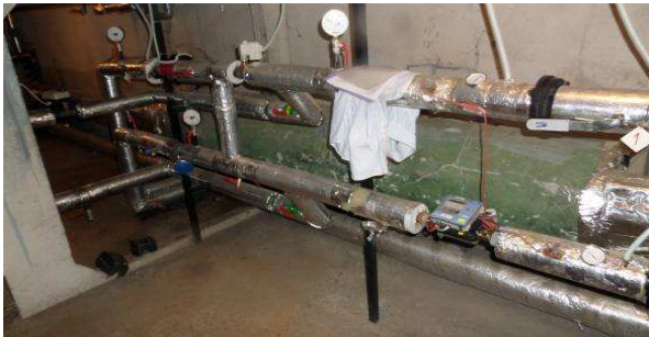
11 pav. Šilumos mazgo fragmentas