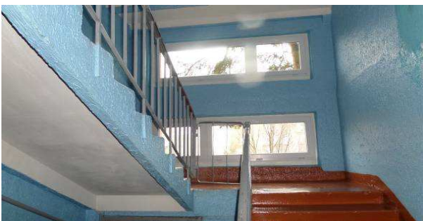
7 pav. Laiptinės langai