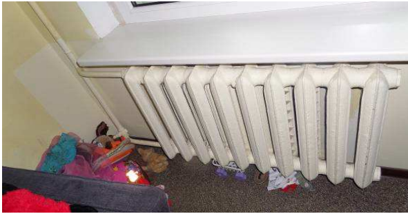
9 pav. Radiatorius bute