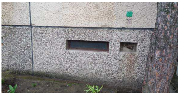
5 pav. Cokolis, rūšio langas