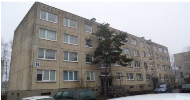
4 pav. Rytinis fasadas