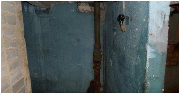
13 pav. Nuotekų stovas rūsyje