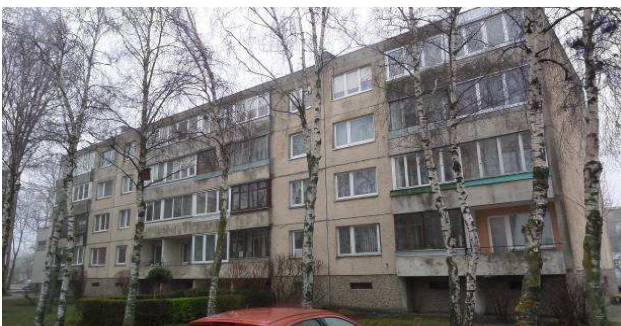
3 pav. Vakarinis fasadas