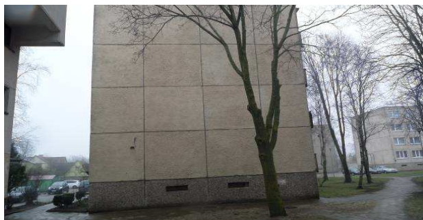
2 pav. Šiaurinis fasadas