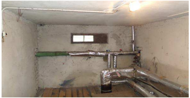
12 pav. Rūsio langas iš šilumos punkto