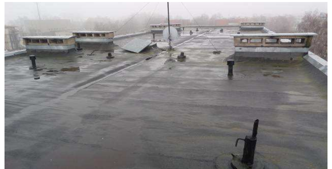
10 pav. Stogas