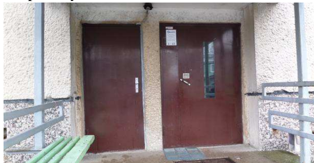
6 pav. Rūšio ir laiptinės lauko durys