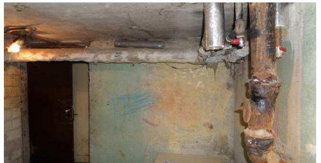
14 pav. Vamzdynai rūsyje