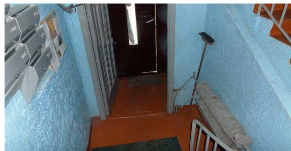
8 pav. Radiatorius laiptinėje, tambūro durys