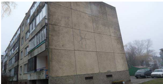
1 pav. Pietinis fasadas