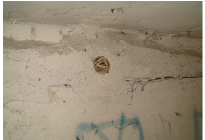
18 pav. El. instaliacija rūsyje