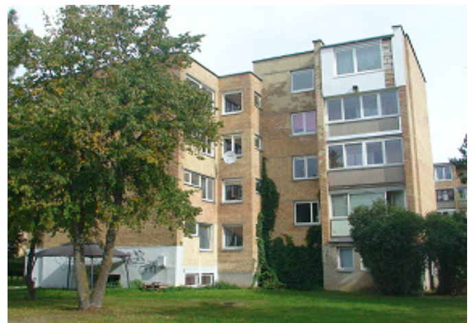
4 pav. Pietvakarių fasadas