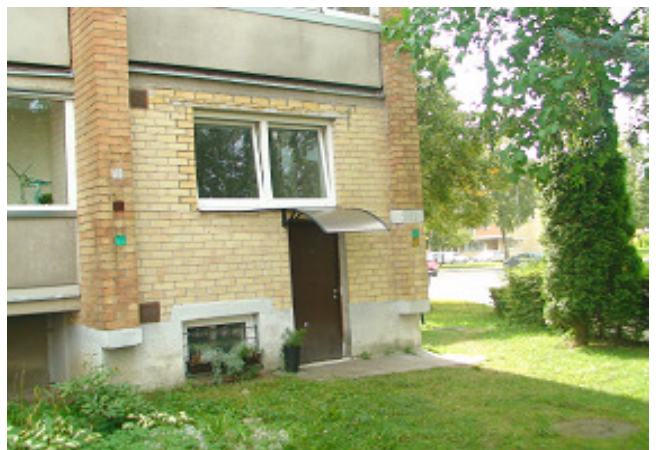
10 pav. Privачios lauko durys