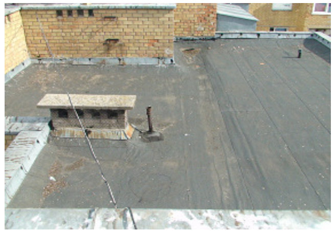
12 pav. Stogas