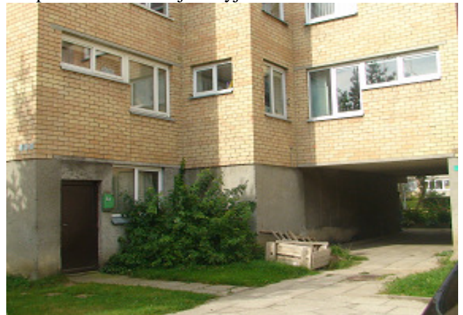
20 pav. Privačios lauko durys