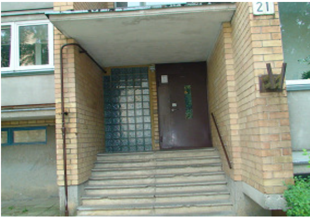
5 pav. Laiptinės lauko durys