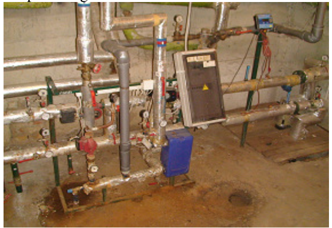
14 pav. Šilumos punktas