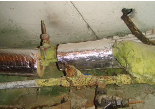
15 pav. Šalto vandens vamzdynai