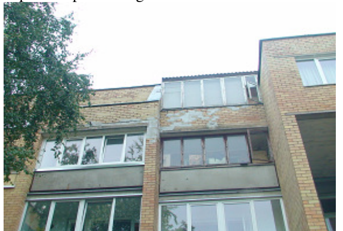
8 pav. Butų balkonai