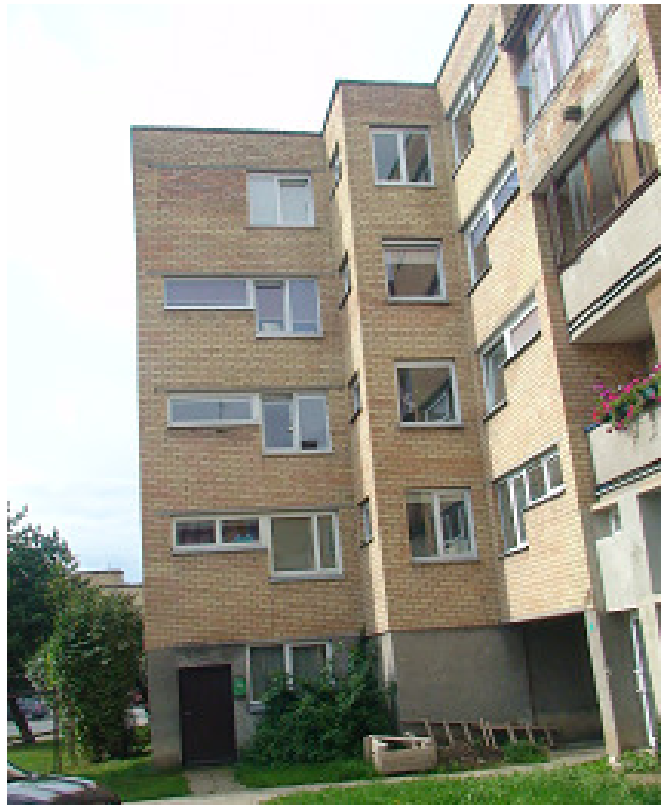
3 pav. Šiaurės rytų fasadas