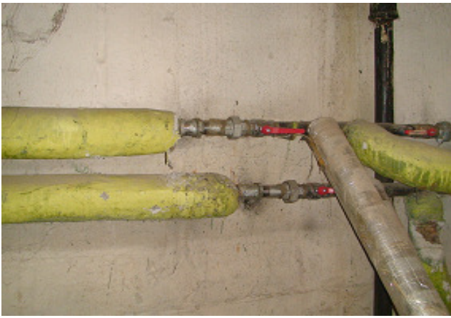
17 pav. KV vamzdynai rūsyje