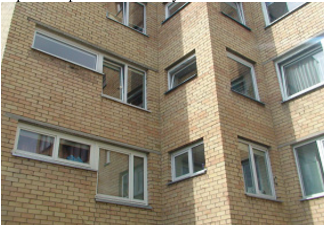
7 pav. Butų langai