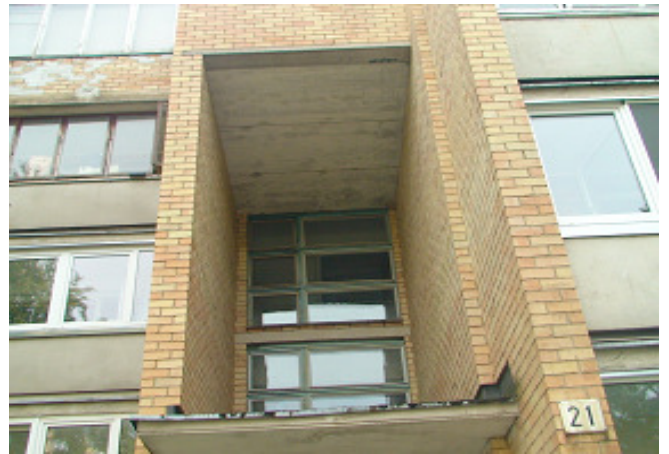
6 pav. Laiptinės langai