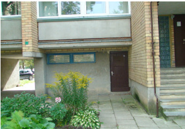
9 pav. Cokolis ir rūšio langas ir lauko durys