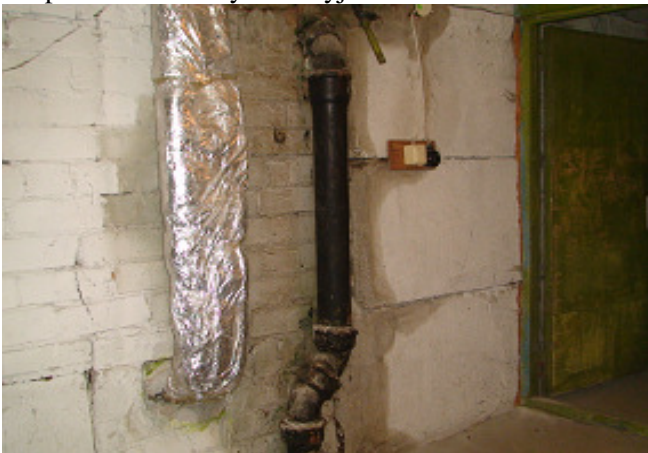
19 pav. Nuotėkų stovas