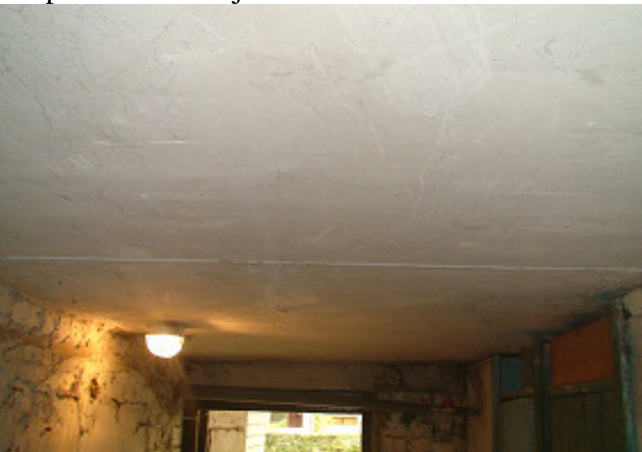
13 pav. Rūsio lubos