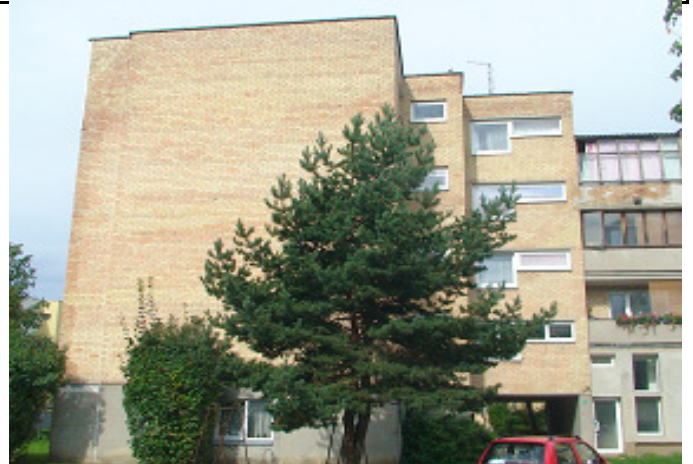
2 pav. Pietryčių fasadas