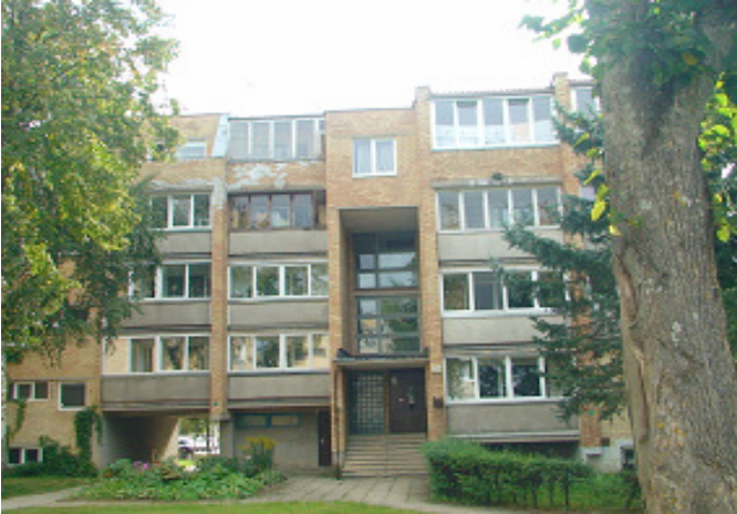
1 pav. Šiaurės vakarų fasadas

Atliko: Inžinierius konsultantas D. Barysa;