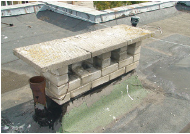
11 pav. Ventiliacijos kaminėlis