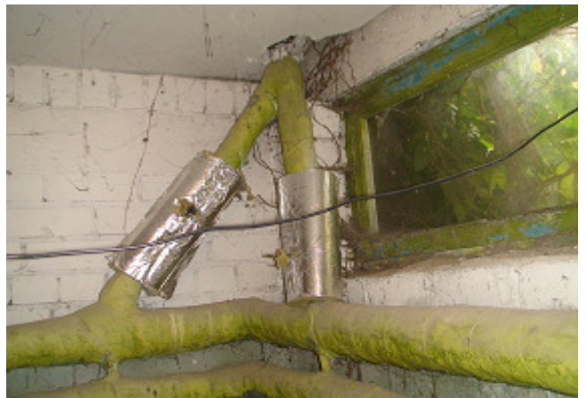
16 pav. Šildymo sistemos vamzdžiai