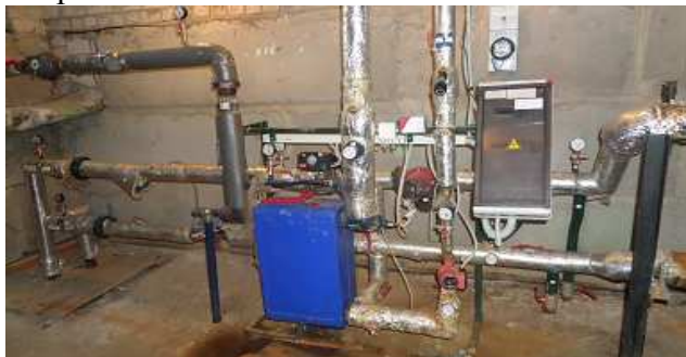
12 pav. Šilumos punktas