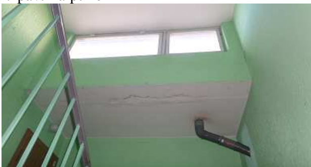
9 pav. Apibėgusios lubos laiptinėje