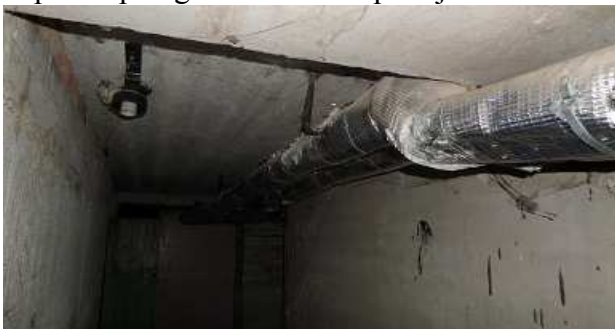
11 pav. Vamzdynai rūsyje