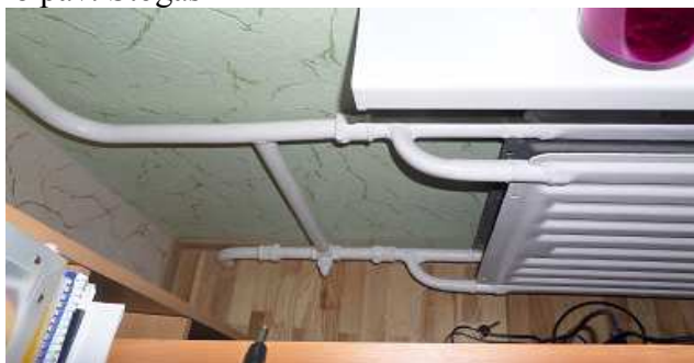
10 pav. Radiatorius bute