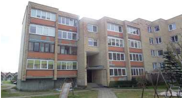
3 pav. Vakarinis fasadas