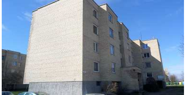
4 pav. Rytinis fasadas