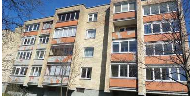
2 pav. Pietinis fasadas