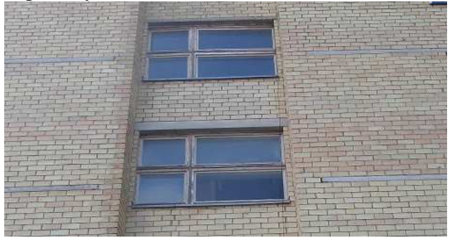
6 pav. Laiptinės langai