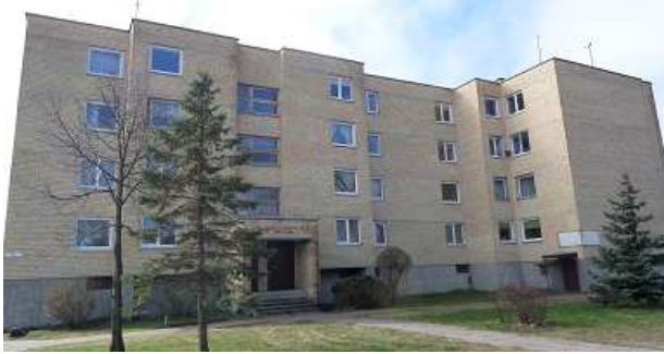
1 pav. Šiaurinis fasadas