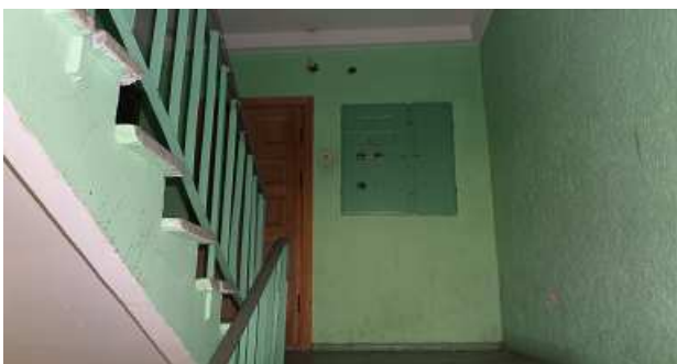
7 pav. Laiptinė