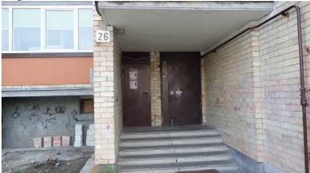
5 pav. Laiptinės lauko durys