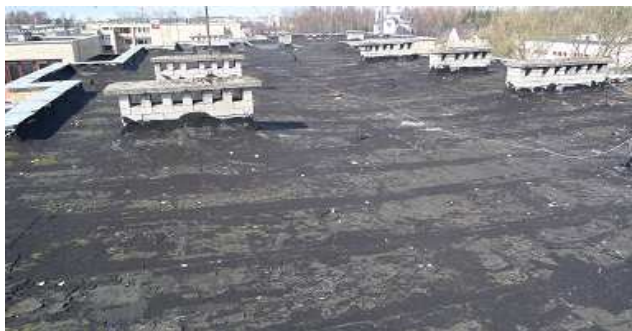
8 pav. Stogas