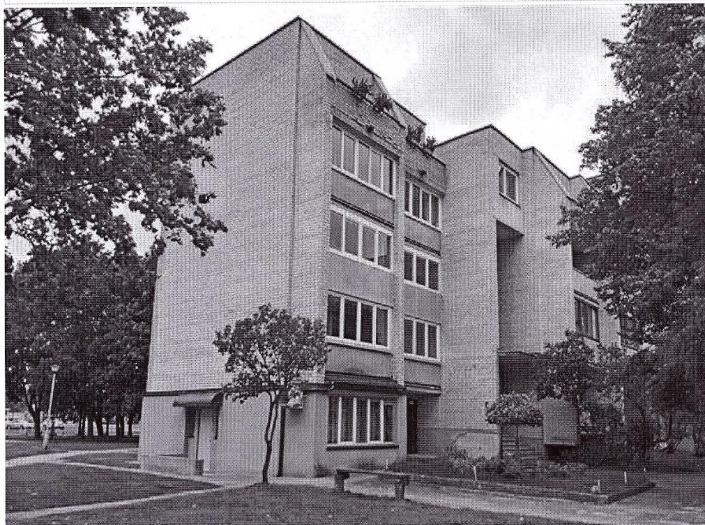
Pastato (jo dalies) fotonuotrauka

Pastatų energinio naudingumo sertifikavimo ekspertas