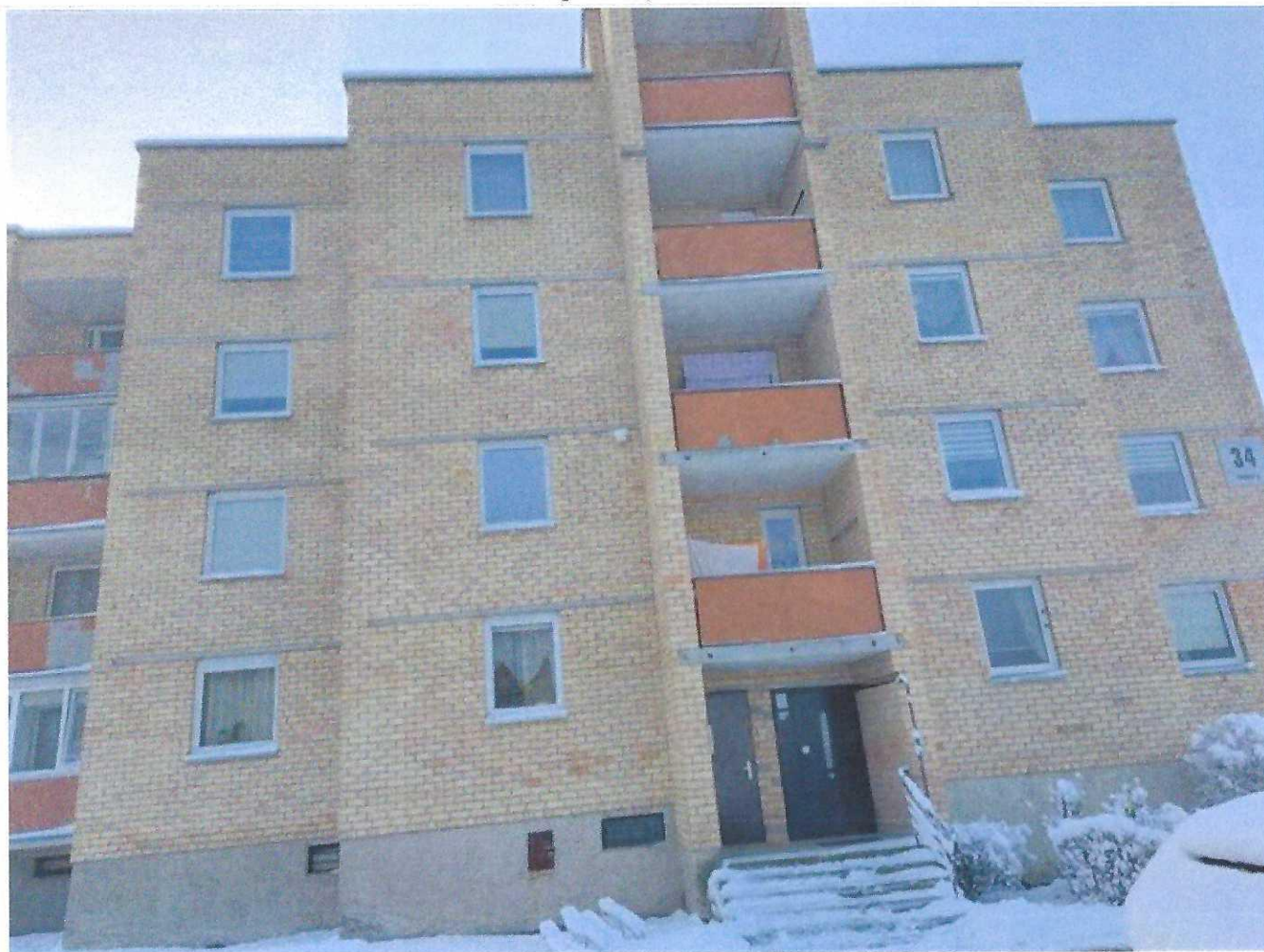
Pastato (jo dalies) fotonuotrauka

Pastatų energinio naudingumo sertifikavimo ekspertas