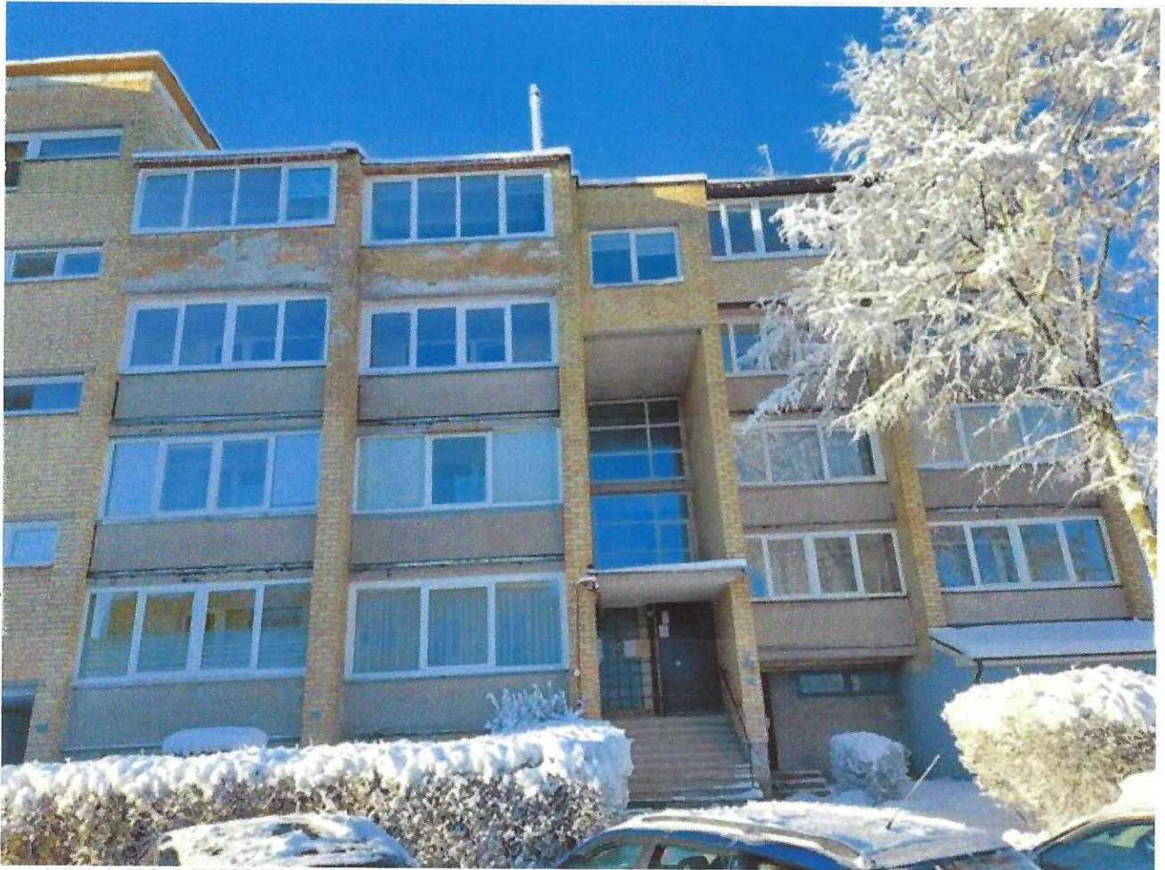
Pastato (jo dalies) fotonuotrauka

Pastatų energinio naudingumo sertifikavimo ekspertas