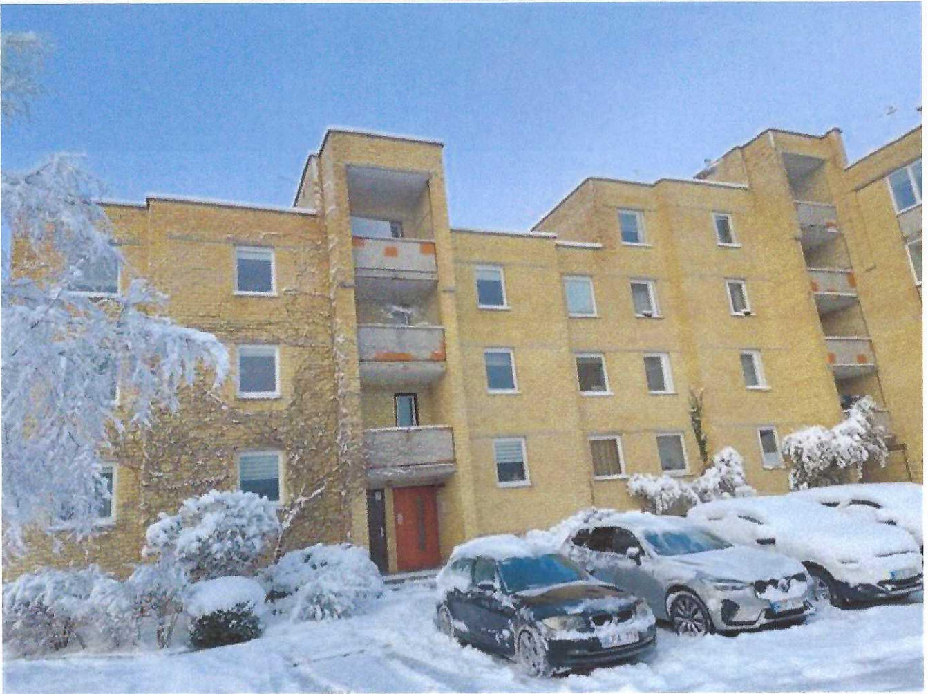
Pastato (jo dalies) fotonuotrauka

Pastatų energinio naudingumo sertifikavimo ekspertas