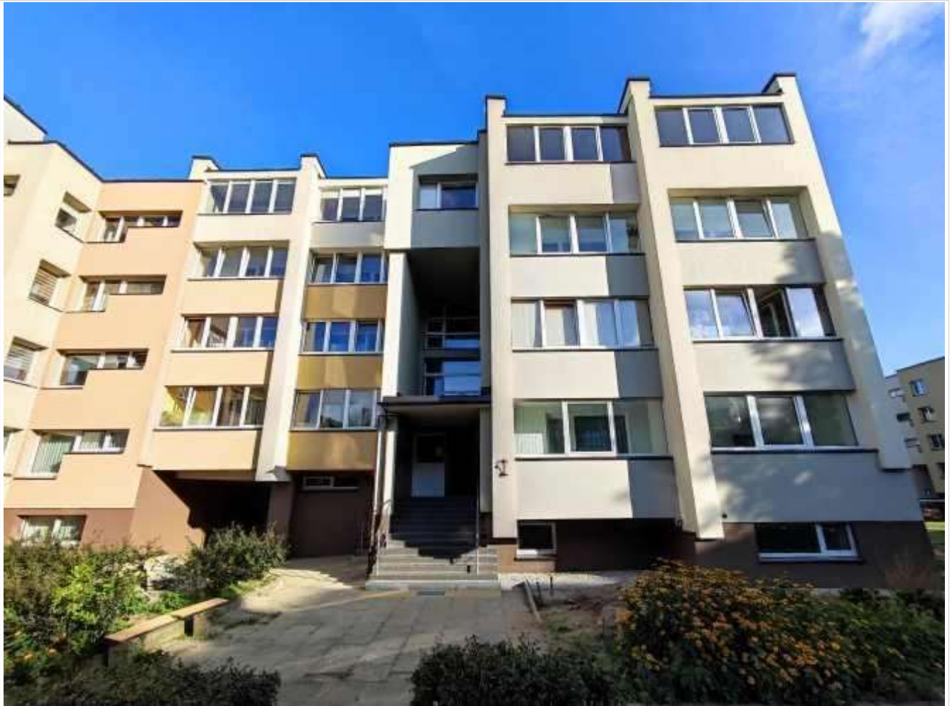
Pastato (jo dalies) fotonuotrauka

Pastatų energinio naudingumo sertifikavimo ekspertas