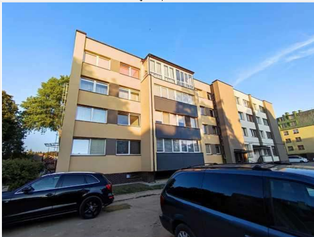
Pastato (jo dalies) fotonuotrauka

Pastatų energinio naudingumo sertifikavimo ekspertas