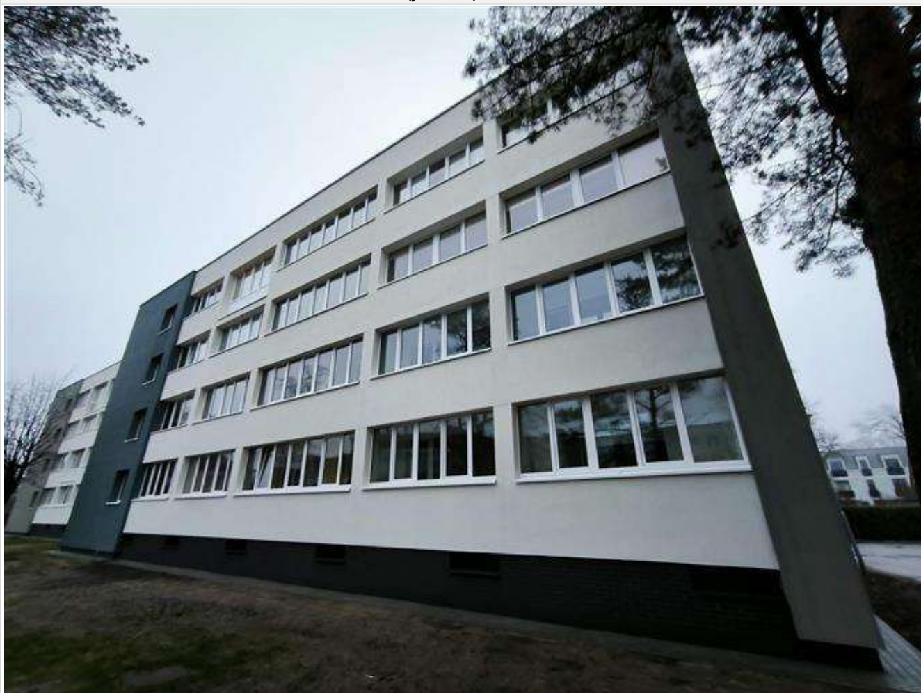
Pastato (jo dalies) fotonuotrauka

Pastatų energinio naudingumo sertifikavimo ekspertas