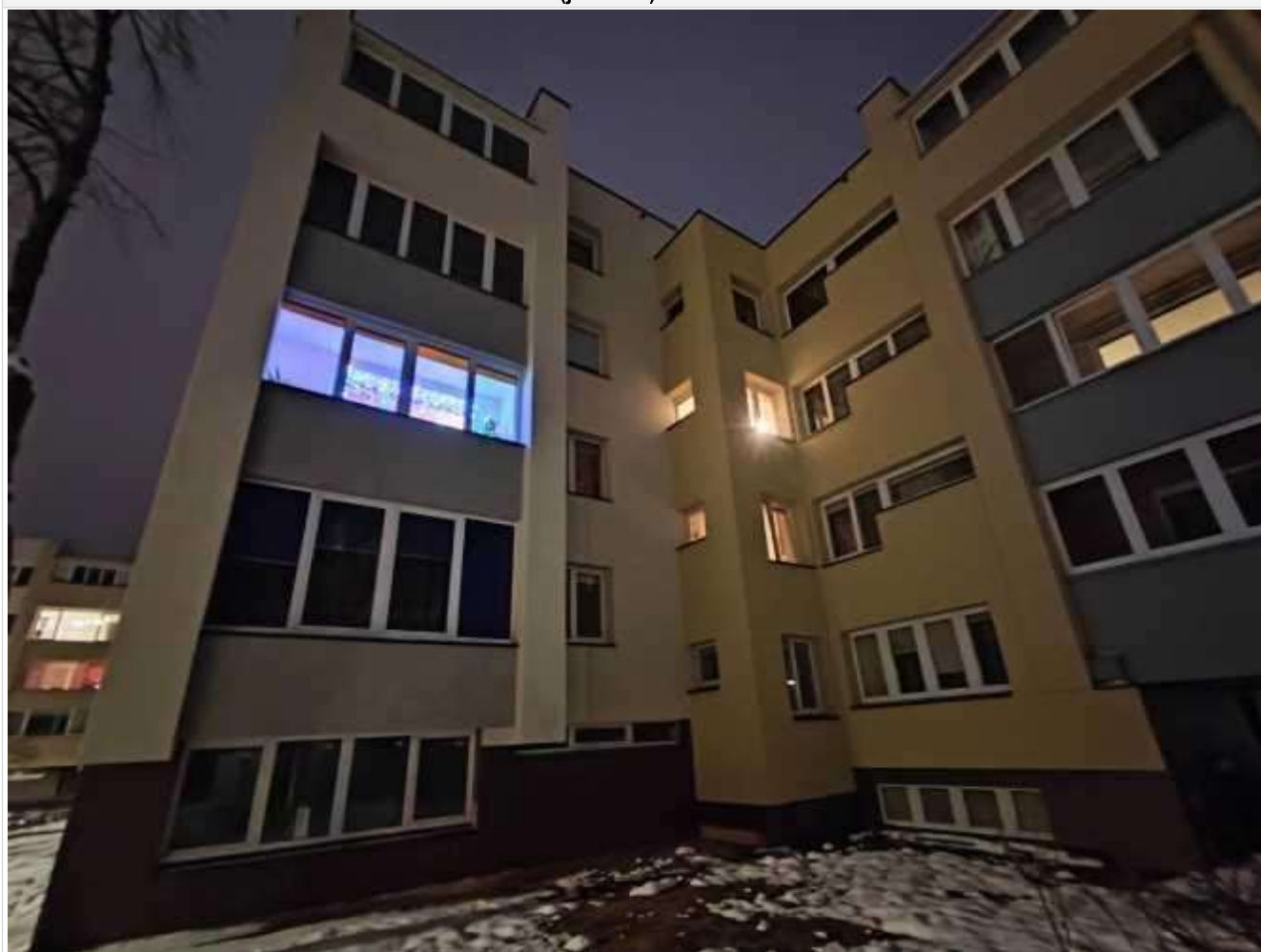
Pastato (jo dalies) fotonuotrauka

Pastatų energinio naudingumo sertifikavimo ekspertas