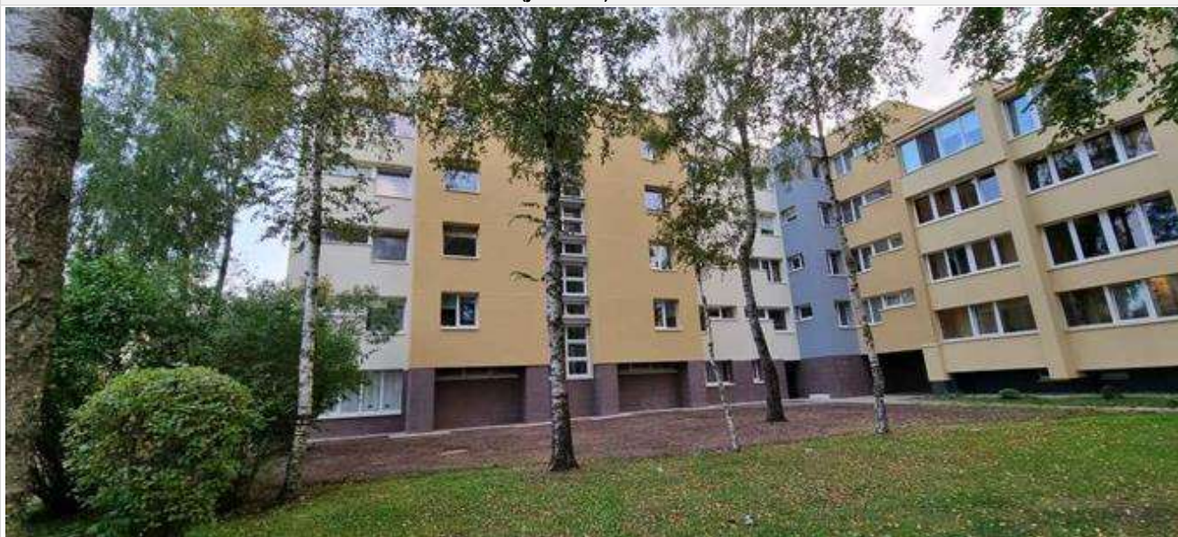
Pastato (jo dalies) fotonuotrauka

Pastatų energinio naudingumo sertifikavimo ekspertas