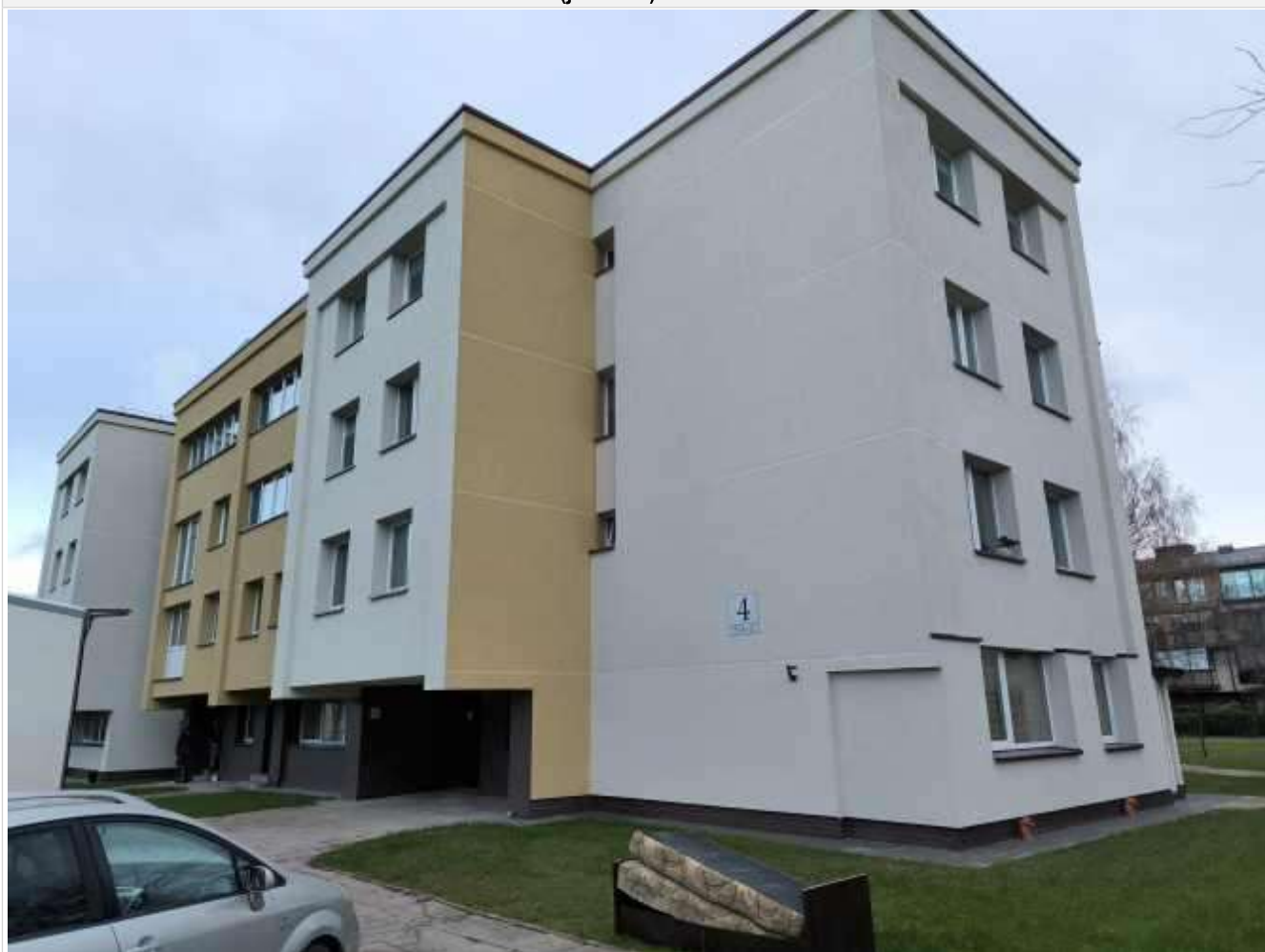
Pastato (jo dalies) fotonuotrauka

Pastatų energinio naudingumo sertifikavimo ekspertas